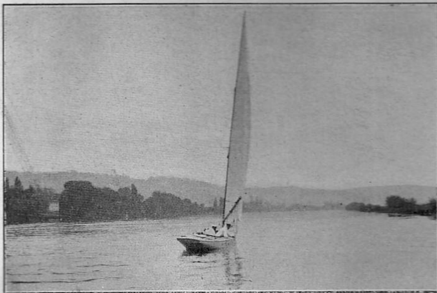
Le yacht anglais Hinemoa , champion du Island Sailing Club pour la Coupe du C. V. P.

pour le calcul de la jauge de chacun des champions :