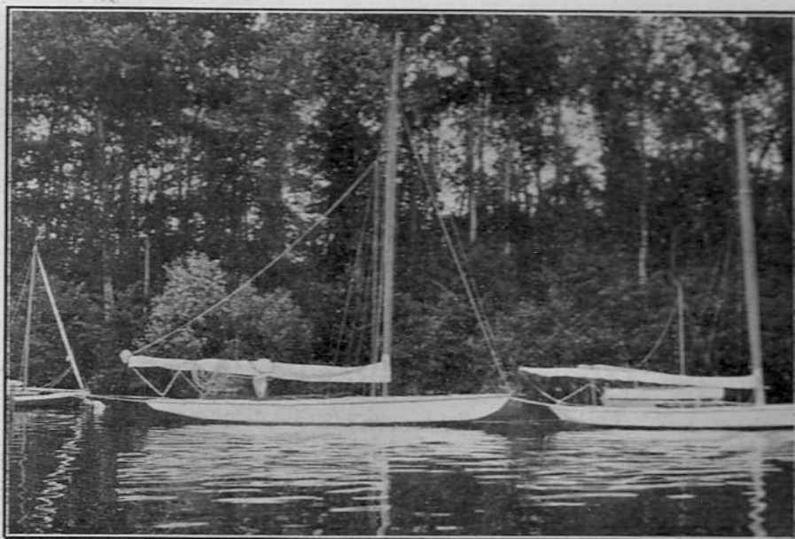
Le yacht allemand Onkel Adolph , champion du Norddeutscher Regatta Verein pour la Coupe du C. V. P.

Chaque yacht portera un numéro d'ordre cousu