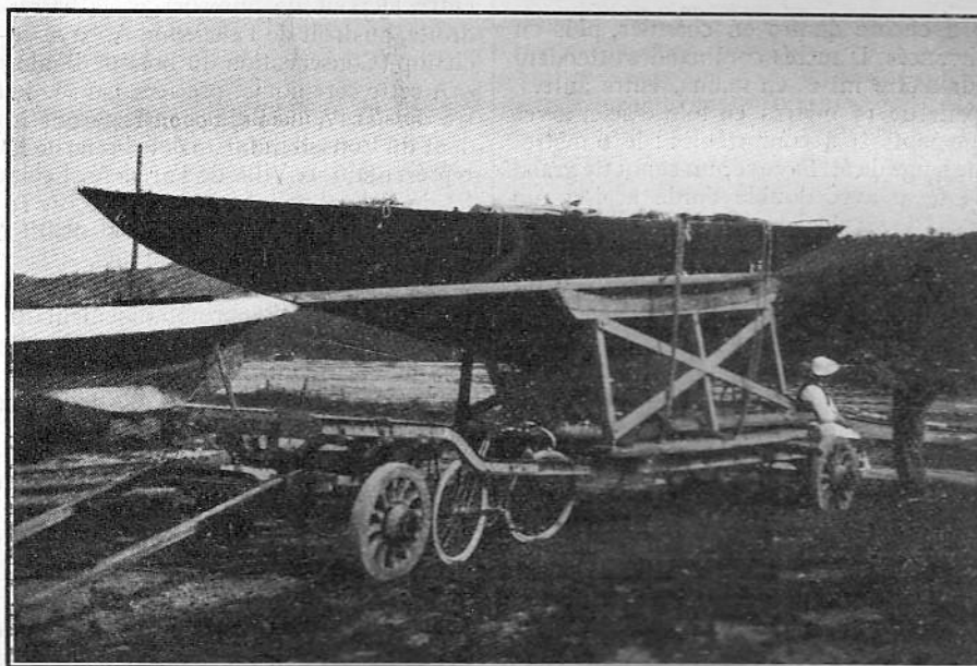
Le yacht belge Princesse Marie-José , champion du Yacht-Club d'Ostende pour la Coupe du C. V. P.

dans sa grande voile. Onkel Adolph , portera le numéro 1; Hinemoa , le numéro 2; Princesse Marie José , le numéro 3; Sogalinda III , le numéro 4; Yvonne , le numéro 5.