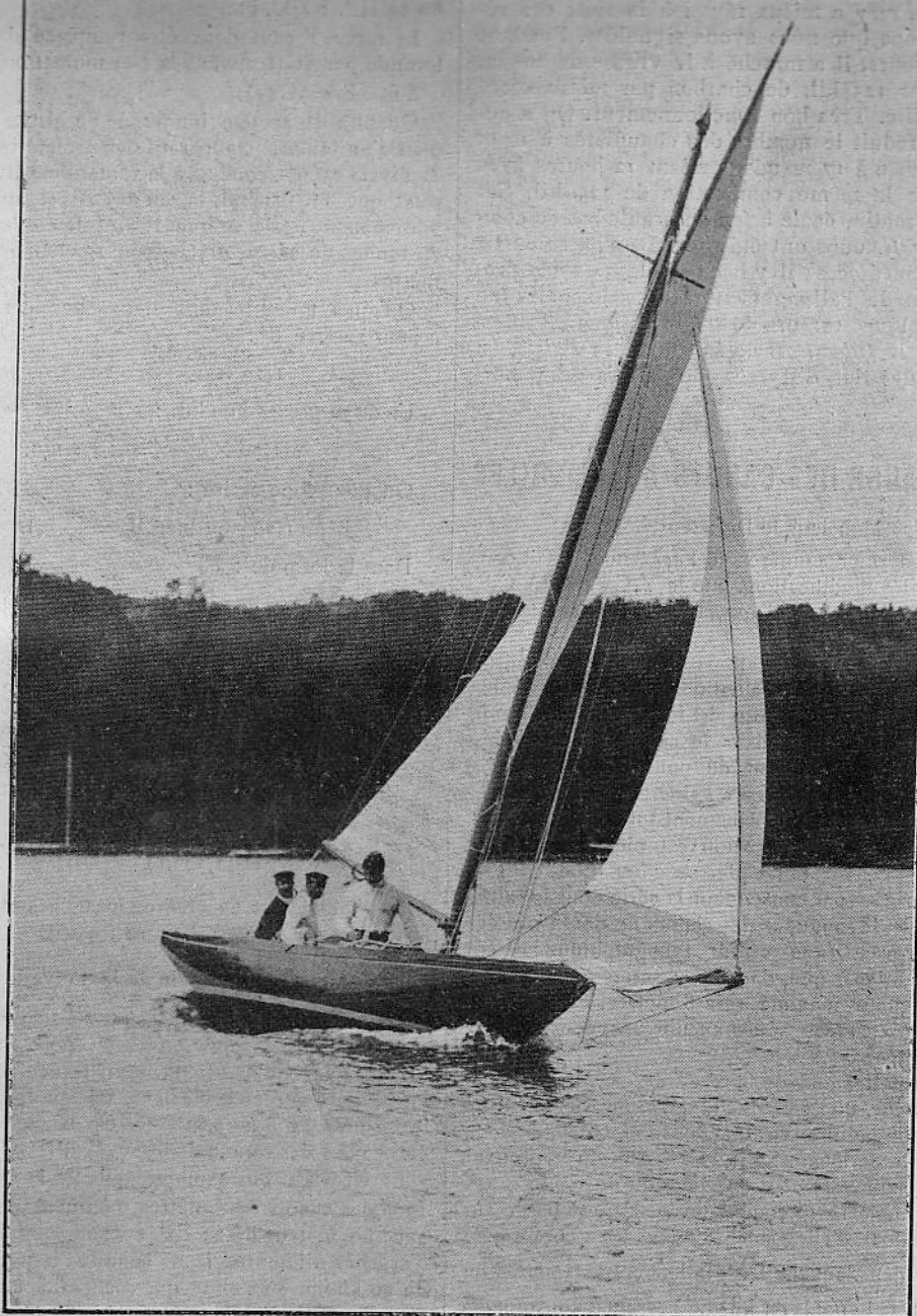
Le yacht Yvonne , champion du C. V. P. pour sa coupe internationale.

1. Onkel Adolph , champion allemand du Norddeutscher Regatta Verein de Hambourg, construit à Hambourg sur les plans de Von Hacht et par son chantier. Guidon rouge avec croix noire bordée de blanc. Equipage : MM. Friedrich Kirsten, H. Von Eiken et W. Tietjens.